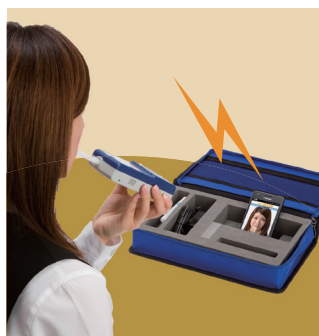
購入時期により、ケースが変更になる場合があります。

物流センター・宿泊先・パーキングエリア...いつ、どこにいても手軽に点検ができ、測定結果が自動的に管理者宛にメール送信されるので、常にリアルタイムの乗務員管理を実現。また自動送信により測定結果の改ざんも防止できます。