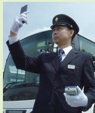
• 携帯電話の対応機種は当社ホームページでご確認ください

各営業所の測定、点呼の結果は クラウド型動画点呼システムで 点呼動画データはいつでも確認可能!